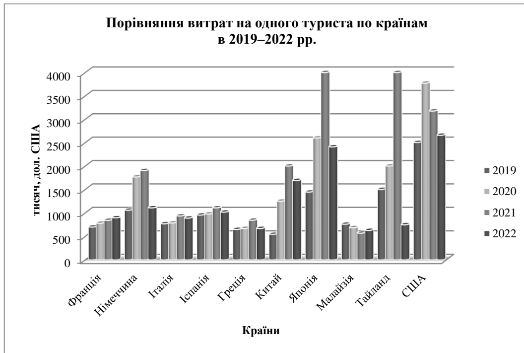
Рис. 1. Порівняння витрат на одного туриста по країнам в 2019–2022 рр.

процес відновлення знаходиться під тиском ряду важливих факторів. В першу чергу, швидкому відновленню перешкоджає загальносвітова економічна невизначеність. В порівнянні з 2019 та 2020 роками значно зросла вартість пасажирських перевезень, а ціни на житло для туристів досягли рекордних значень, що призводить до збільшення рівня витрат на одного туриста. Дані, наведені на рис. 1, демонструють тренд росту витрат на подорож для одного туриста практично на всіх найпопулярніших світових напрямках. Виключення складають Малайзія і Тайланд, де через тривалі проти пандемічні заходи процес відновлення розпочався тільки в 2022 році.